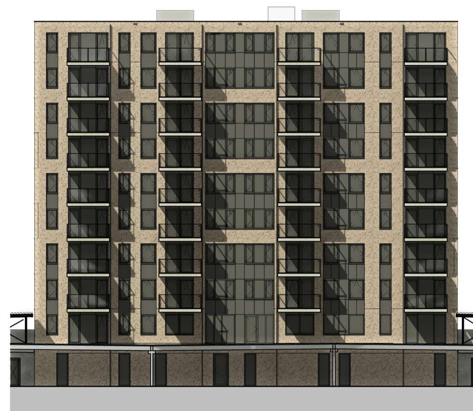
Westgevel blok C 1 : 200