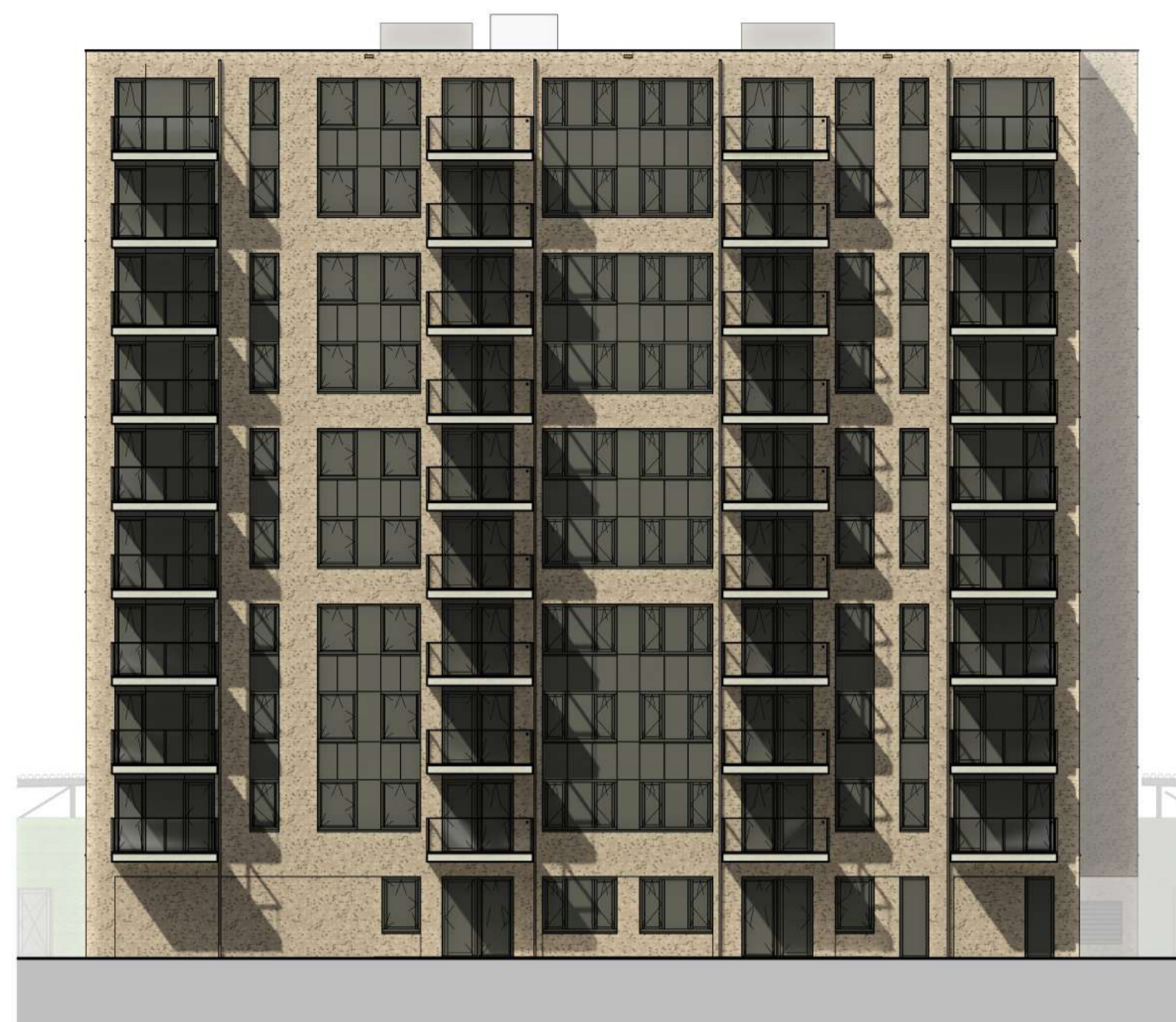
Oostgevel blok C 1 : 200