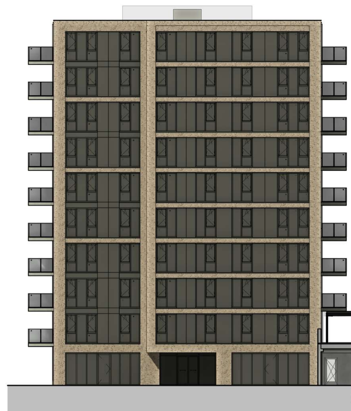
Noordgevel blok C 1 : 200